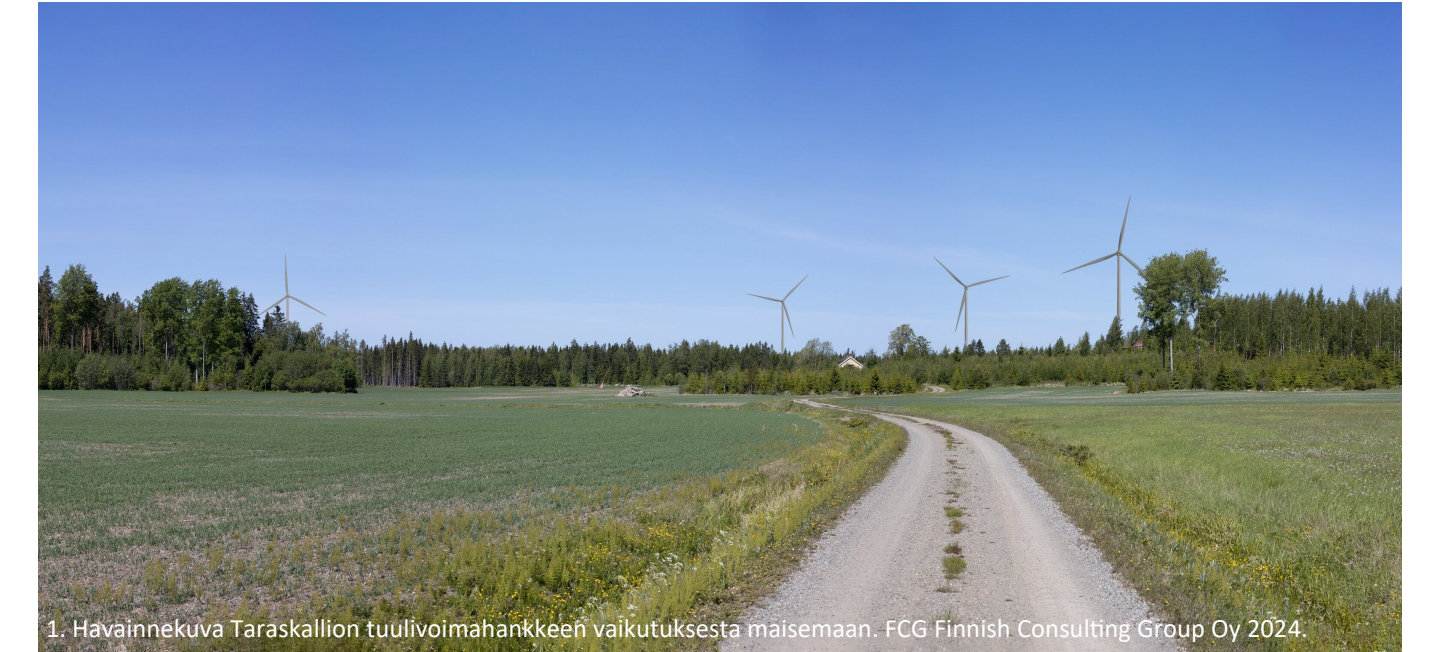
1. Havainnekuva Taraskallion tuulivoimahankkeen vaikutuksesta maisemaan. FCG Finnish Consulting Group Oy 2024.

Kaavoitusohjelmaan 2025–2027 voi tutustua kaupungin verkkosivuilla: https://www.huittinen.fi/asuminen-ja-ymparisto/kaavoitus-maankaytto-ja-rakentaminen/kaavoitus-2/kaavoitusohjelma-ja-katsaus/