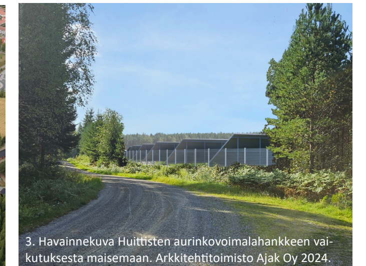
3. Havainnekuva Huittisten aurinkovoimalahankkeen vaikutuksesta maisemaan. Arkkitehtitoimisto Ajak Oy 2024.