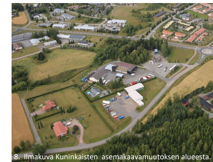
8. Ilmakuva Kuninkaiisten asemakaavamuutoksen alueesta.