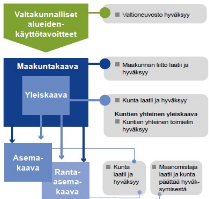
Kuva 1. Kaavajärjestelmä (ELY Opas 5/2016)