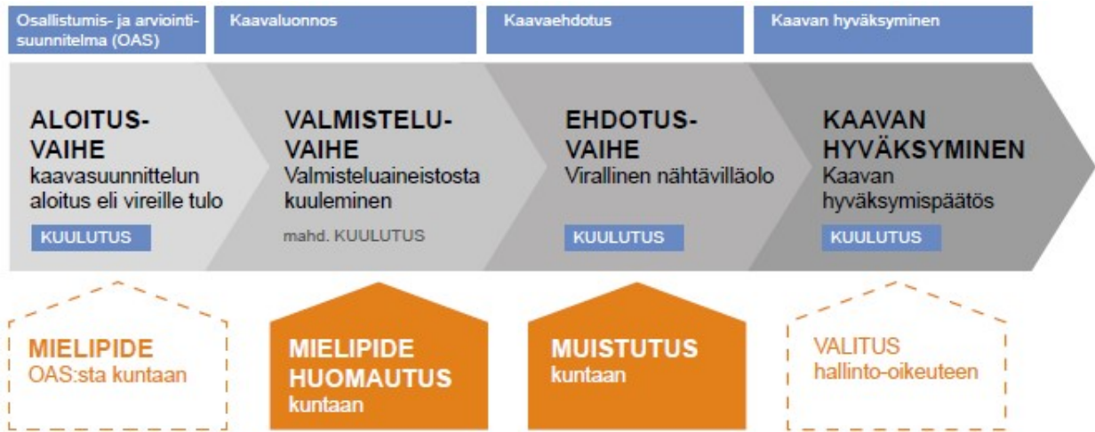
Kuva 2. Osallistuminen kaavaprosessin eri vaiheissa (ELY Opas 5/2016)