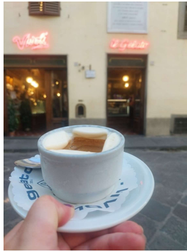
7. Perinteinen Affogato – jäätelökahvi kahvilan edustalla.

Firenze on turvallinen matkakohde yksinmatkustavalle. Matka ja kurssi oli monella tavalla tärkeä kokemus. Sataopiston kannalta, Sataopisto on ottanut ensimmäiset askeleensa kohti kansainvälistymistä. Samalla Sataopiston halu kouluttaa opettajistoaan sitouttaa myös opettajakuntaa sekä edistää opettajien hyvinvointia.