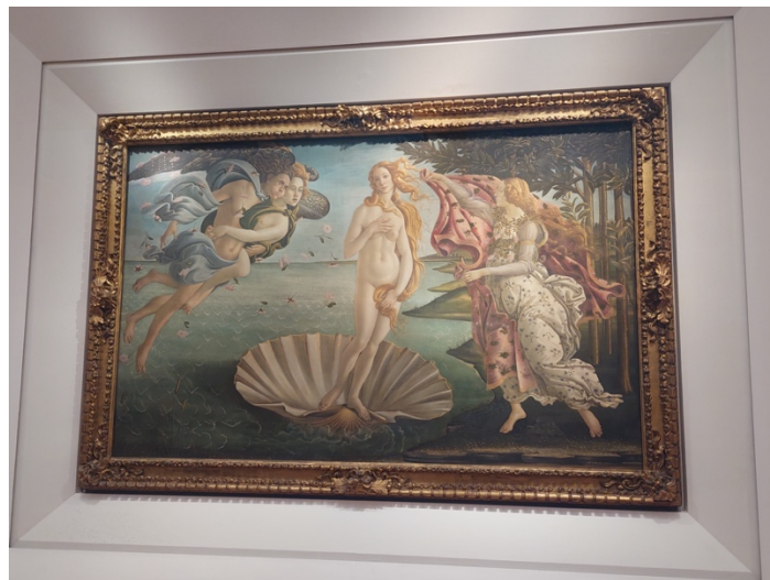
5. Botticellin "Venuksen Syntymä" Uffizin taidemuseossa.

Uusi tietämys kytkeytyi aiempaan osaamiseen. Historian ja taiteen harrastajana kurssi oli siis täydellinen valinta. Firenze, renesanssiaikakauden keskuksena ja entisenä pääkaupunkina, tarjoi ihmeteltävää ympäri kaupunkia niin arkkitehtuurissa, kuvanveistossa kuin museoissa. Kurssin ulkopuolellakin riitti paljon nähtävää ja koettavaa Firenzen Tuomiokirkosta (Cattedrale de Santa Maria del Fiore, Il Duomo) viini-ikkunoihin.