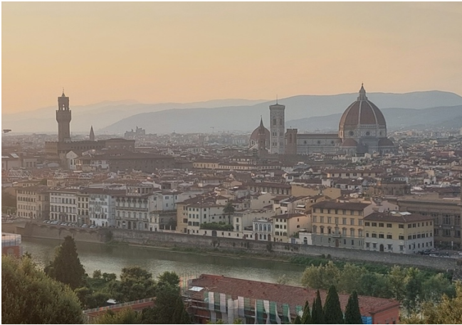
1. Piazzale Michelangelon upea näkymä Firenzen kaupunkiin. Arno-joki halkoo kaupungin.