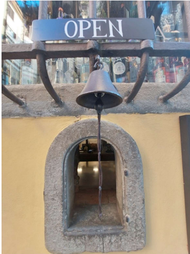
6. Kelloa soittamalla viini-ikkunoista sai ostettua viiniä tai muita virvokkeita. Viini-ikkunoita on noin parisataa Toscanan alueella.