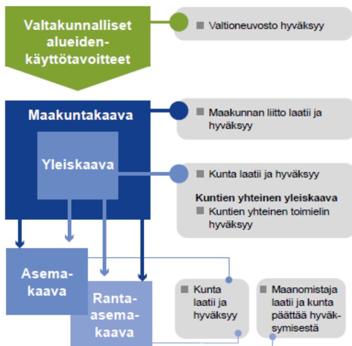
Kuva 1. Kaavajärjestelmä (ELY Opas