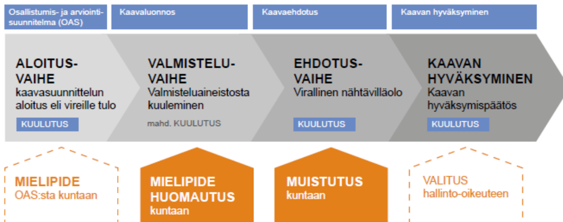
Kuva 2. Osallistuminen kaavaproessin eri vaiheissa (ELY Opas 5/2016)