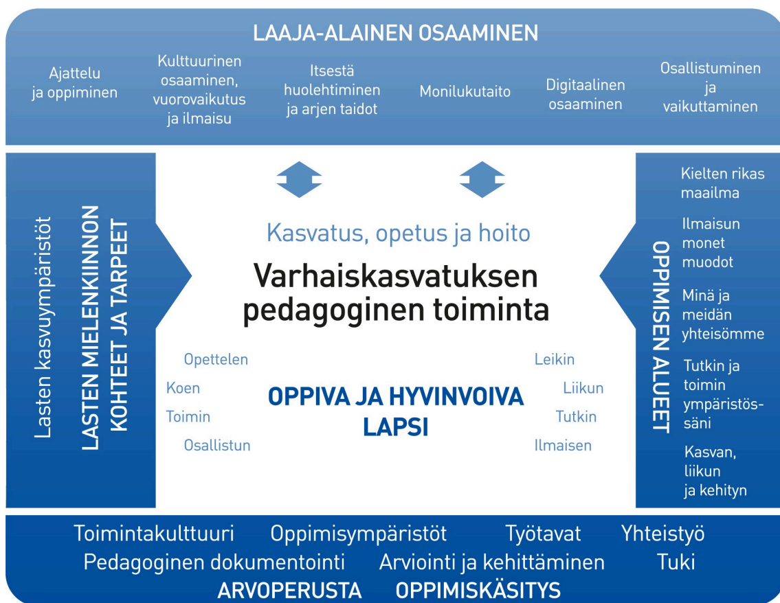
Kuvio 1. Varhaiskasvatuksen pedagogisen toiminnan viitekehys

Varhaiskasvatuksen pedagogista toimintaa ja sen toteuttamista kuvaa kokonaisvaltaisuus. Tavoitteena on edistää lasten oppimista ja hyvinvointia sekä laaja-alaista osaamista (kuvio 1). Pedagoginen toiminta toteutuu lasten ja henkilöstön välisessä vuorovaikutuksessa ja yhteisessä toiminnassa. Lasten omaehtoinen, henkilöstön ja lasten yhdessä ideoima sekä henkilöstön suunnittelema toiminta täydentävät toisiaan. Varhaiskasvatuksen pedagoginen toiminta läpäisee kasvatuksen, opetuksen ja hoidon kokonaisuuden.