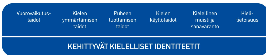
Kuvio 2. Lasten kielen kehityksen keskeiset osa-alueet varhaiskasvatuksessa

Kielen oppimisen kannalta on tärkeää tiedostaa, että saman ikäiset lapset voivat olla eri vaiheissa kielen kehityksen eri osa-alueilla. Kielelliset identiteetit kehittyvät , kun lapsia ohjataan ja tuetaan kielellisten taitojen ja valmiuksien keskeisillä osa-alueilla.