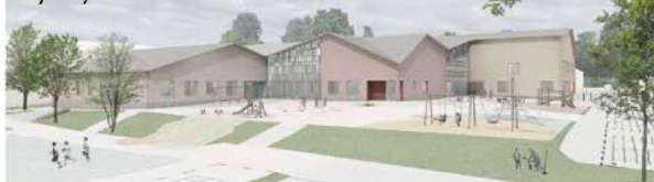
Uusi ja viihtyisä alakoulu aloittaa toimintansa 2024.

– Jo tunnissa ehdit kulkemaan pitkospuilla ja rauhoittua lumoavissa suomaisemissa. Yhtä helposti saavutettavia ovat muutkin luontokohteemme ja ihan keskustassakin pääset nauttimaan virtaavasta vedestä ja puistoista.